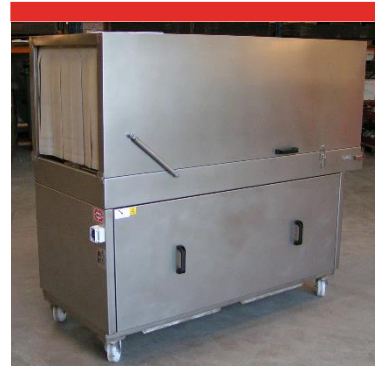
UNITÉ DE SÉCHAGE 200TD/XL