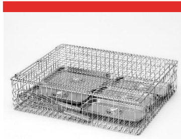
CAGE EN INOX POUR PETITS USTENSILES

Système haute performance, conception pratique et peu encombrante.